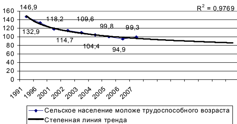
Рисунок 3. Динамика и прогноз численности населения моложе трудоспособного возраста в сельской местности Чувашской Республики до 2010 г.

Снижение уровня занятости и рост уровня экономической активности в среднесрочной перспективе приведут к росту безработицы. В результате сельская безработица может достигнуть социально опасных пределов и си-