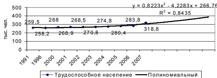
Рисунок 2. Динамика и прогноз численности сельского населения в трудоспособном возрасте в Чувашской Республике до 2016 г.

Employment, unemployment, labour market.