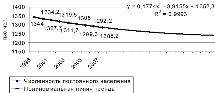
Рисунок 1. Прогноз численности постоянного населения Чувашской Республики до 2016 г.

Данная категория сократится к 2010 году на 9,6% и составит 90,6 тыс.