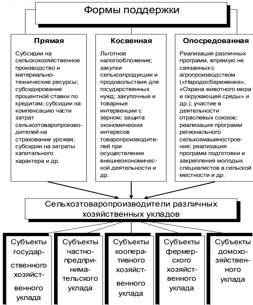
Рисунок 2. Формы государственной поддержки субъектов хозяйствования АПК