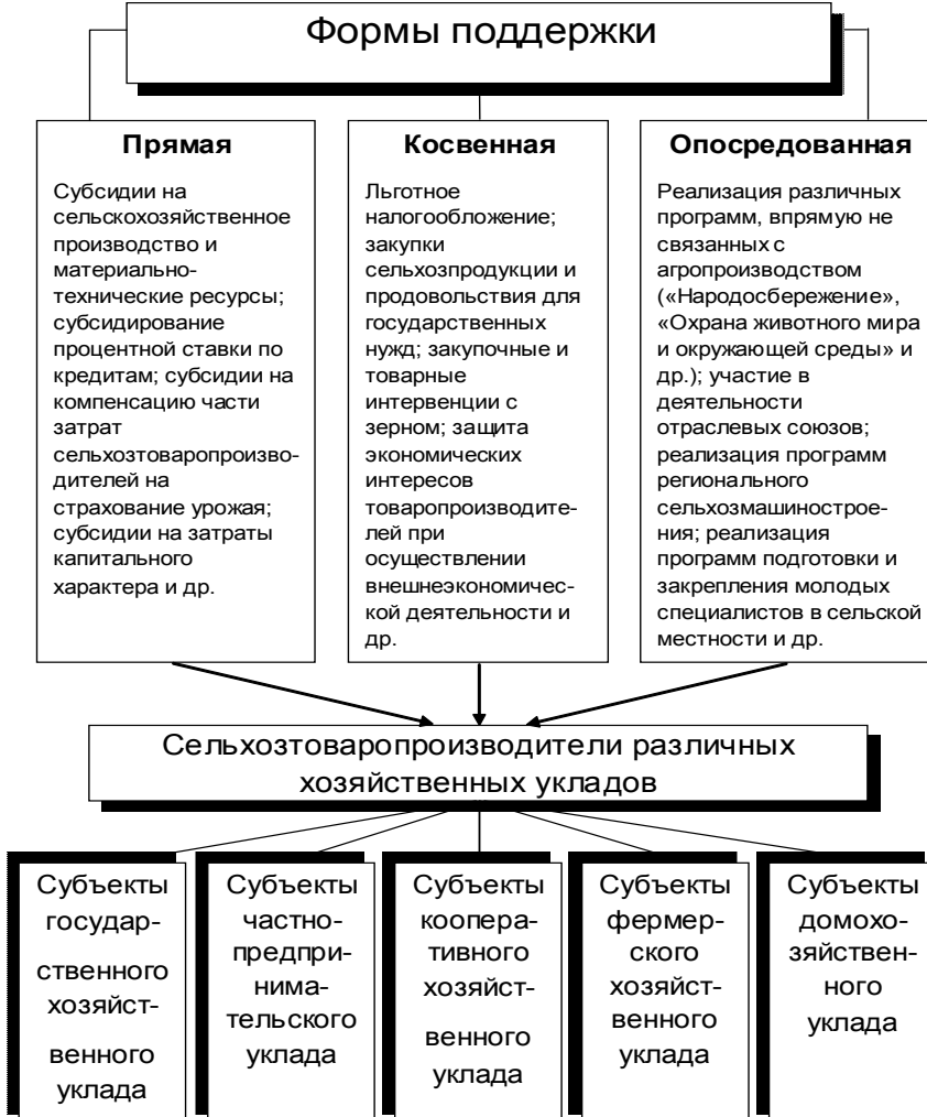
Рисунок 2. Формы государственной поддержки субъектов хозяйствования АПК