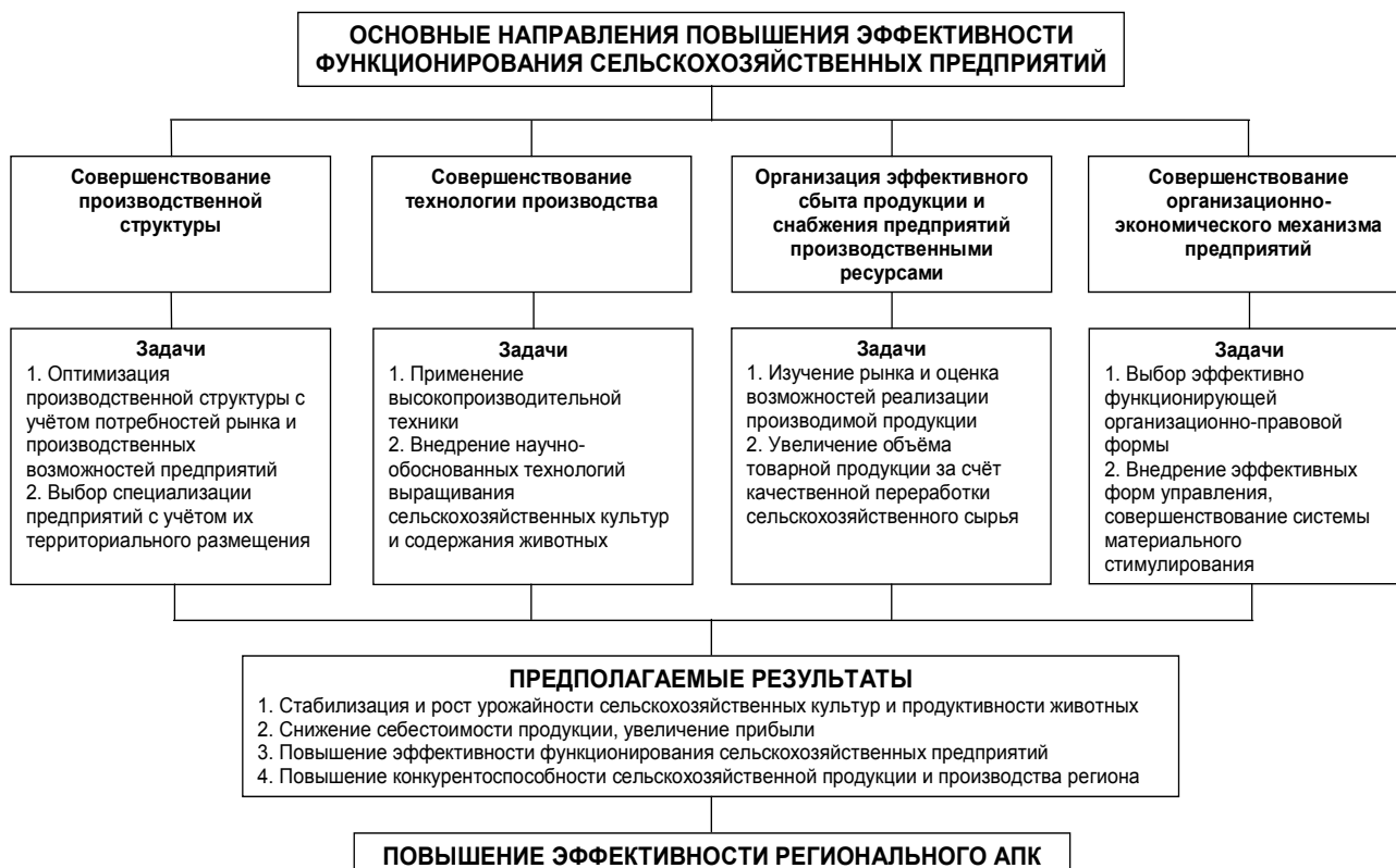
Рисунок 2. Система повышения эффективности функционирования сельскохозяйственных предприятий Пермского края

Практическая реализация наших предложений направлена на стабилизацию и рост урожайности сельскохозяйственных культур, продуктивности животных, снижение себестоимости продукции, увеличение прибыли пред-